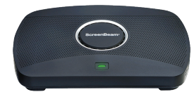
ScreenBeam 1100 Plus 软件随ScreenBeam 1100 Plus免费提供，无需授权费用

ScreenBeam Conference软件可将会议室的摄像头、麦克风和音箱以无线方式连接到会议主持人的设备*。用户可以通过他们的笔记本电脑和所选的统一通信（UC）会议服务，参加预定的或临时的会议，充分利用会议室的外围设备。ScreenBeam Conference软件可有效避免接触，实现更加安全的会议体验。